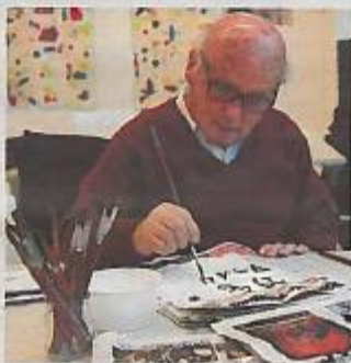
A trabalhar no museu que tem o seu nome