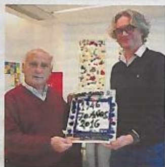
Entrega da capa ao diretor do jornal da Fundação

podesse pintar, foi uma maldade que eu fiz, mas com atitude. Pretendi contar o passado; pareceu que foi uma brincadeira, mas há uma mensagem que quis transmitir: o passado já não interessa, agora olhamos para o futuro. Tapei o passado e abri o futuro.